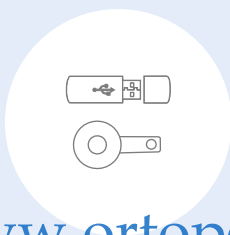
Paquete de actualización