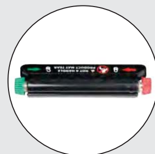
ROHO® ISOFLO MEMORY CONTROL®

El cojín proporciona una distribución uniforme de la presión en toda su superficie, reduciendo los picos de presión en las zonas críticas.