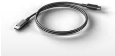
Cable de carga