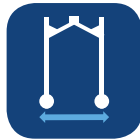
Anchura de la base ▼