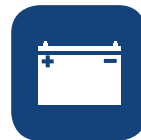
Ciclos (elevaciones por carga)** ▼