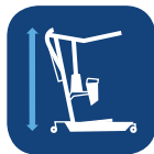
Máx. Altura (con brazo corto/extendido) ▼