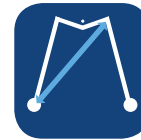
Radio de giro ▼