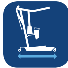
Longitud de la base ▼