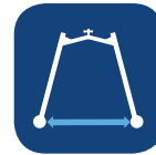
Ancho interno con patas abiertas ▼