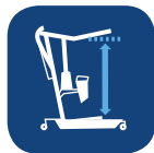
Rango de elevación (con brazo corto/extendido) ▼