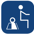
Peso seguro SWL ▼

Todas las medidas se han realizado con ruedas de 100mm, placa de bipedestación inclinada 5° y un usuario de 80kg. Todas las medidas han sido tomadas con una tolerancia de + 3%.