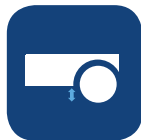
Distancia al suelo ▼