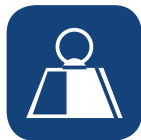
Peso total producto ▼