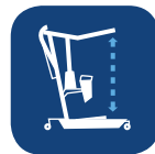
Velocidad de elevación ▼