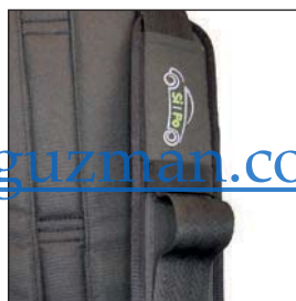
MONTAJE SIN HERRAMIENTAS