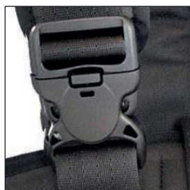
CIERRE DE SEGURIDAD