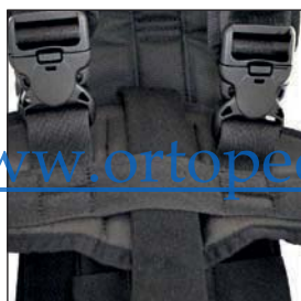
FÁCIL DE INSTALAR Y MUY SEGURO