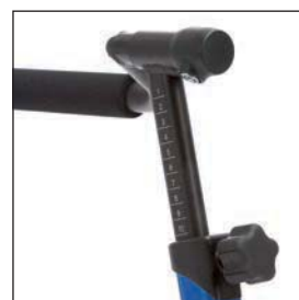
EMPUÑADURAS AJUSTABLES EN ALTURA