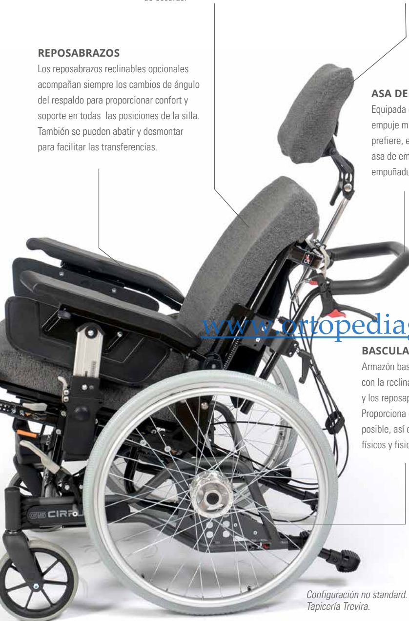
Configuración no standard. Tapicería Trevira.

La base adaptadora trapezoidal permite unir el armazón con moldes u otros tipos de unidades de asiento diferentes a las disponibles en la Cirrus G5. Gracias a su doble sistema de bloqueo, ha superado satisfactoriamente las pruebas CRASH-TEST para un transporte seguro en un vehículo, y en cualquier situación del día a día.